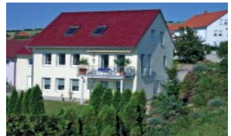
2003 Arnstein eigenes Haus