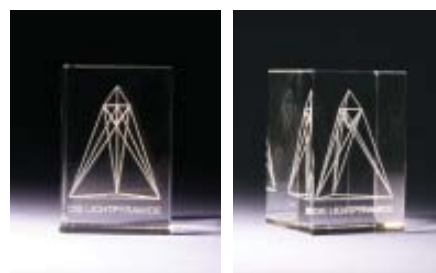
Die Holografische Lichtpyramide im Glaswürfel

Antwort: Selbstverständlich stehen sie jedem zur Verfügung. Wenn sie in euren Räumlichkeiten existiert, ist die Wahrnehmung eine andere. Ihr mögt es als intensiver empfinden. Zum anderen könnt ihr euch an der Schönheit, die hier auf allen Ebenen so existiert, erfreuen und euch über diesen Weg daran erinnern, dass ihr ebenfalls solche wunderbaren, schönen Wesen seid. Niemals müsst ihr eine Hilfe in Anspruch nehmen, ihr dürft, dass ist euer Göttliches Recht.