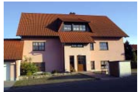
2000 Schwanfeld gemietetes Mehrfamilienhaus