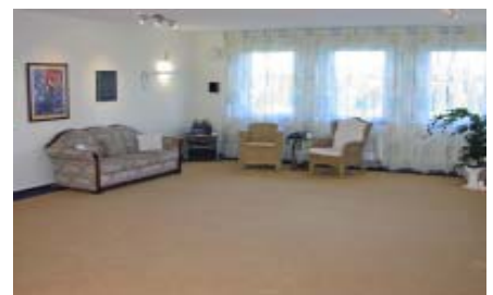
2003 unser Seminarraum in Arnstein