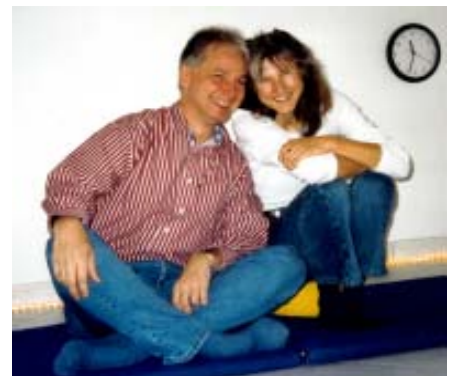
2000 Schwanfeld Spass im Seminarraum